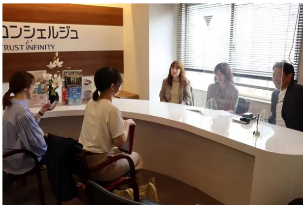
対面での初ミーティングの様子