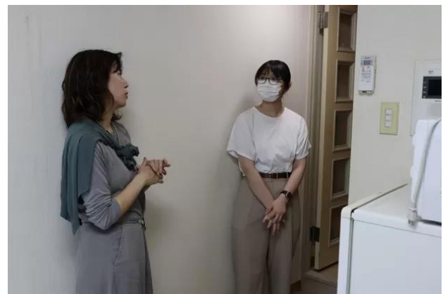
実際の物件を見ながらの打ち合わせ